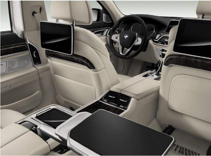
Pachet Executive Lounge